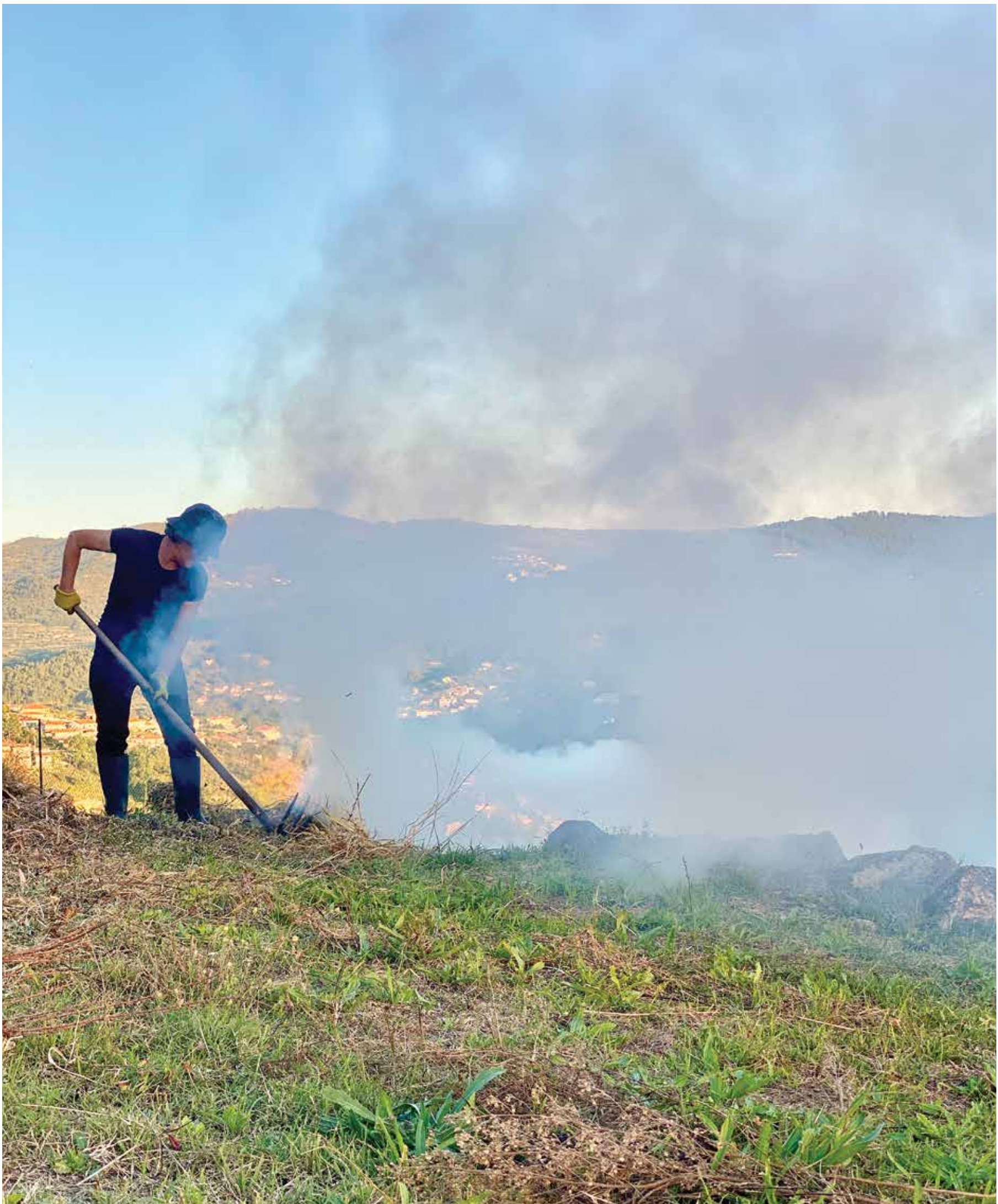
O amanho da terra